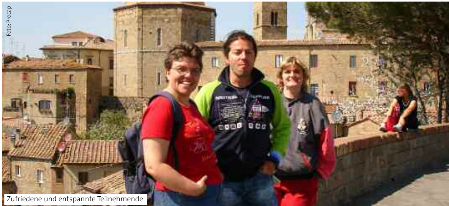
Zufriedene und entspannte Teilnehmende

Erholung pur: sanfte Bewegung, hervorragende Küche, verträumte Landschaft, Blütenpracht, schöne Zimmer und freundliche Gastgeber.