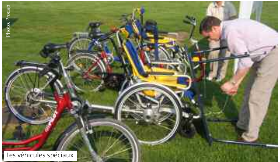
Les véhicules spéciaux

Les participants handicapés sont arrivés individuellement ou en groupe. Par le biais d'une collaboration et d'une entraide actives, des sections de la région ont pris