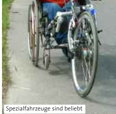
Spezialfahrzeuge sind beliebt